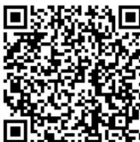
Рисунок 4 — Сценарий для проведения дебатов «Идеология радикализма»

Первая команда всегда будет представлять сторону радикальной идеологии. Задача команды студентов – найти контраргументы тех радикальных и спорных тезисов, которые будет озвучивать первая команда. Тем самым, участники будут вынуждены критически рассматривать постулаты радикальных идеологий, искать в них логические ошибки, несоответствия – самостоятельно приходить к выводу о деструктивности любой радикальной идеологии (см. рисунок 4).