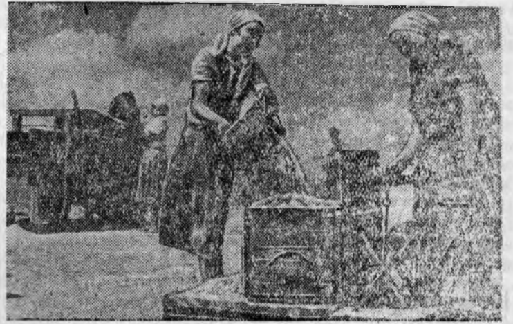
ОЧИСТКА И ВЗВЕШИВАНИЕ ЗЕРНА.

С первого дня уборки нового урожая колхоз «Радлиское село» (Херсонского сельского района, Николаевской области) хорошо организовал работу на току для сдачи государству высококачественного зерна.