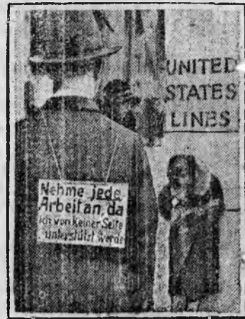
НА СНИМКЕ: СЛЕВА—Безработный интеллигент идет по улицам Берлина с плакатом: „Согласен на любую работу“ СПРАВА безработная в Америке играет на мандолине зарабатывая себе на хлеб.

Под ударом кризиса Экономический кризис и его последствия безработица и нужда ударили не только по пролетариату, но и по интеллигенции. Сотни тысяч безработных высоко образованных людей, миллионы безработных пролетариев омулись на пороге голодной смерти. Голод выгнал их на улицу и заставил нищенствовать.