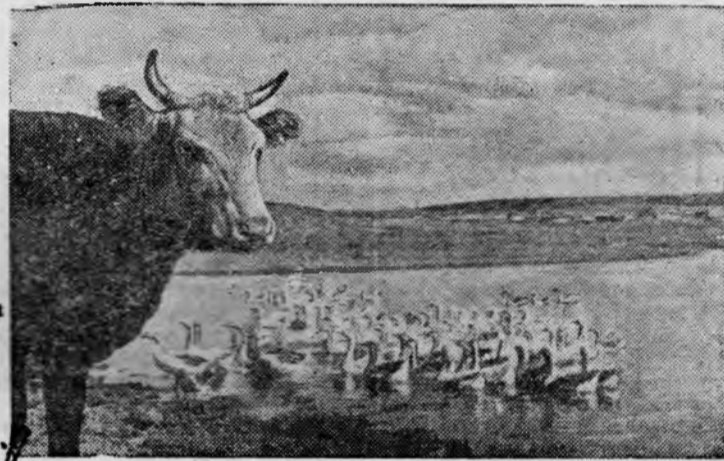
На пруду колхоза «Красный мерин» (Муштаевский район, Чкаловская область). Колхоз—участник ВСХВ 1939-40 годов и кандидат на участие в 1941 году.