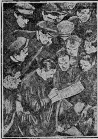
Вот как подписываются на заем в некоторых местах

Все силы, всю волю, все возможности на борьбу за семена для второго большинства весеннего сева! Янов.