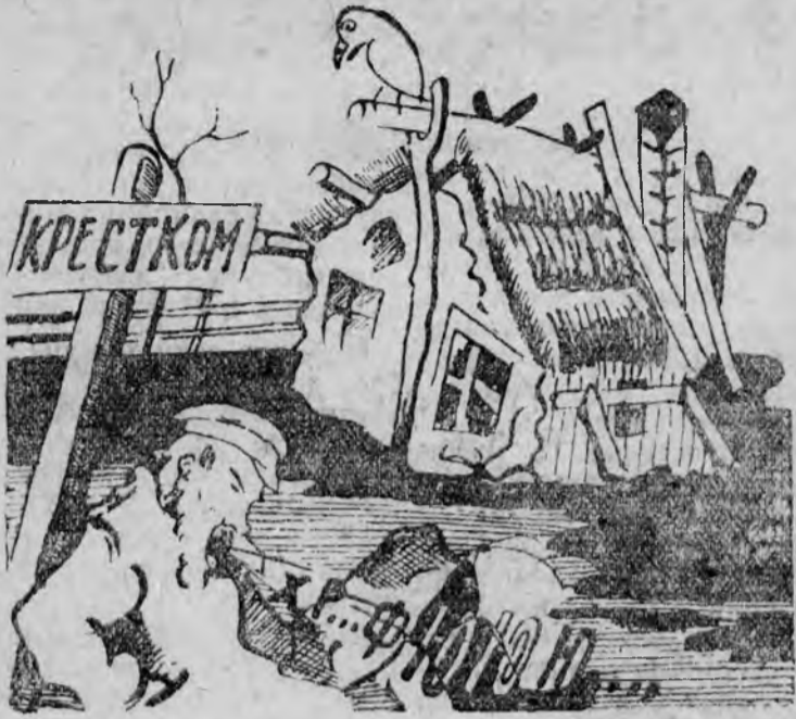
Что ты спишь мумишек? Ведь весна, если еще не на дворе, то во всяком случае, близко.

Председателям 3 селькредкомов вынесен выговор за невыполнение директив о сборе не прикосновенных фондов.