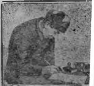
На зван „5—в 4"

Адреса на газетах и налах пишутся неравноразлично. Часто невозможно определить что и кому адресовано.