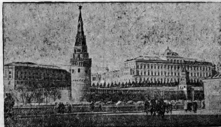
Вид на Кремль со стороны Каменного моста.