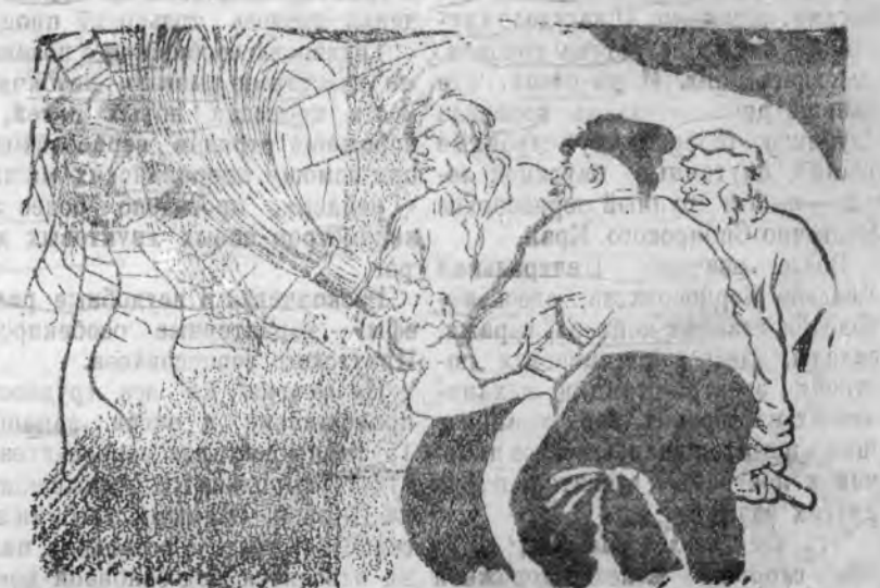
Колхозники сельхозартели «Она» должны разрушить кулацкое гнездо