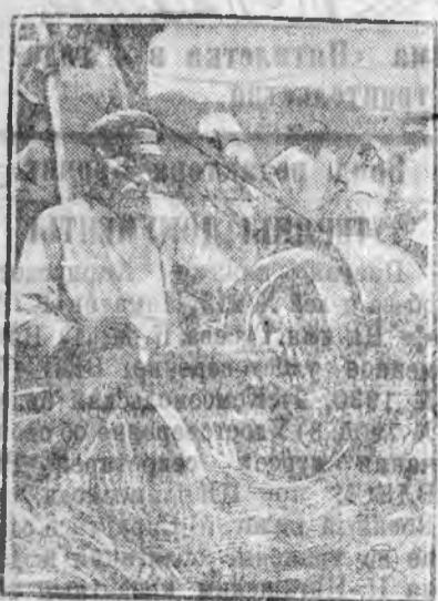
Немедленным обмоластом ускорим сдачу хлеба излишков государству

Колхозники сельхозартели «Она» должны разрушить кулацкое гнездо