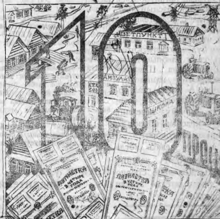
10 проц отчисления от займа «Пятилетка в 4 года» на местное строительство

Все как один подпишемся на заем! Ни одного колхозника, ни одного единоличного крестьянского двора без облигации займа «пятилетка в 4 года».