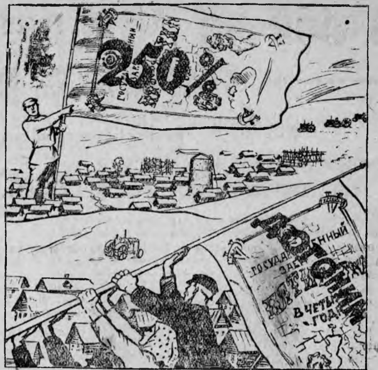
РАВНЯЙТЕСЬ ПО ЛУЧШИМ