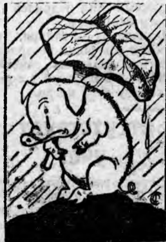
ТАКУЮ ЗИМОВКУ ГОТОВИТ СКОТУ ИВАНОВ