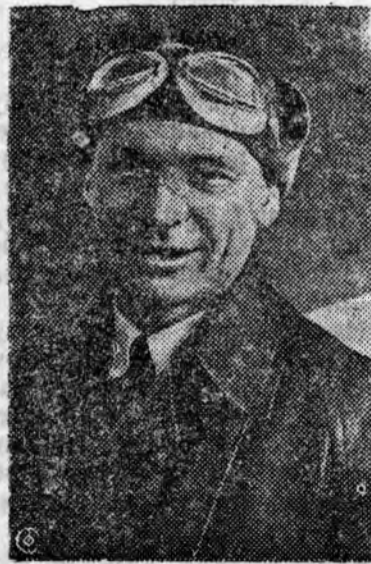
Летчик-испытатель В. Конникин за последнее время установил три международных высотных рекорда. Международной авиационной федерацией эти рекордные высотные полеты внесены в официальный список международных рекордов. 7 сентября В. Конникин совершил новый высотный полет с нагрузкой в 2000 кг. на высоту 11.295 метров.

Сейчас новый дирижабль передается в эксплуатацию.