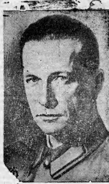
Герой Советского Союза М. М. ГРОМОВ

Построив прекрасный „АНТ-35“, наша советская авиационная промышленность одержала еще одну блестящую победу.