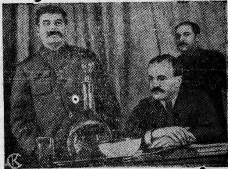
Совещание передовых комбайнеров с членами ЦК ВКП(б) и Правительства в зале заседаний ЦК ВКП(б) 1 декабря 1935 г. НА СНИМКЕ: выступление СТАЛИНА Н. В. В президиуме: т. т. МОЛОТОВ В. М. КАГАНОВИЧ Л. М.

Ведь ничто не приходит само. Поэтому каждый гектар должен быть хорошо обработан, посеяны прополоты, и даже, где требуется, не один раз, урожай убран своевременно. В этом во всем—залог высокого урожая, в этом—залог зажиточной и культурной жизни колхозников.