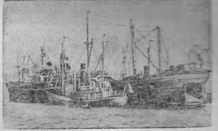
Китобойные суда на рейде в бухте „Золотой рог“ (Владивосток).

Налоговая инспекция равного финансового отдела план второго квартала по налогам и сборам выполнила на 114,7 процента. Впереди всех идет Амурский сельсовет (налоговый агент тов. Матюшов) который добился выполнение плана по сельсовету на 134 процента, Илийский сельсовет (налоговый агент тов. Ерофеев) план по сборам за это же время выполнил на 115 процентов и Бродский сельсовет (налоговый агент тов. Распопин) — на 113 процентов.