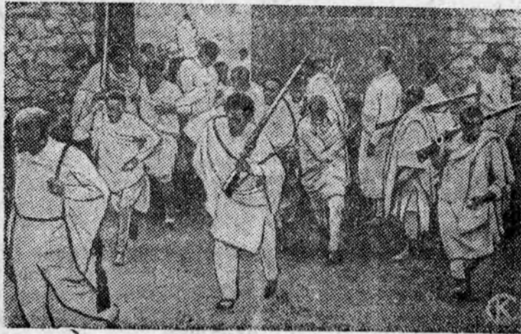
На снимке: Абиссинские добровольцы получают в Аддис-Абебе оружие перед отправкой на фронт.