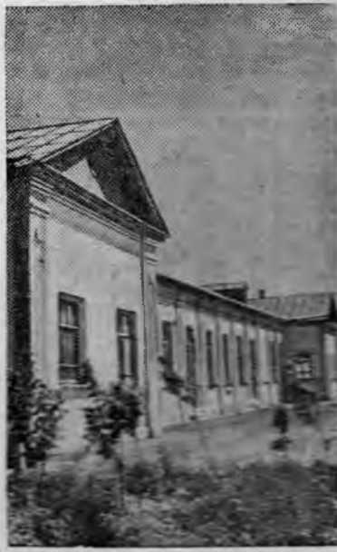
Новый клуб в колхозе-миллионере „Полезный труд“ (Арystовский район, Южно-Казахстанская область).