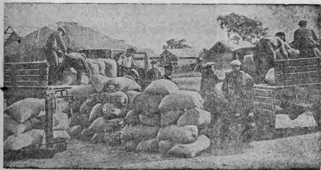
Отгрузка пшеницы из колхоза имени XII-летия РККА (Химган-Архаринский район) на заготовку.

Колхозники Хабаровского края сдают зерно государству по хлебопоставкам.