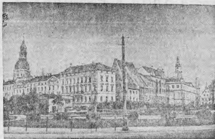
Бульвар имени 11 ноября в г. Риге (Латвийская ССР).