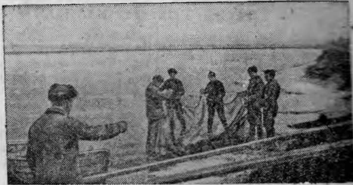
Бригада рыбаков из Никольск-Уссурийского леспромхоза, выделенная для снабжения свежей рыбой рабочих на лесозаготовке, готовит сети к лову.