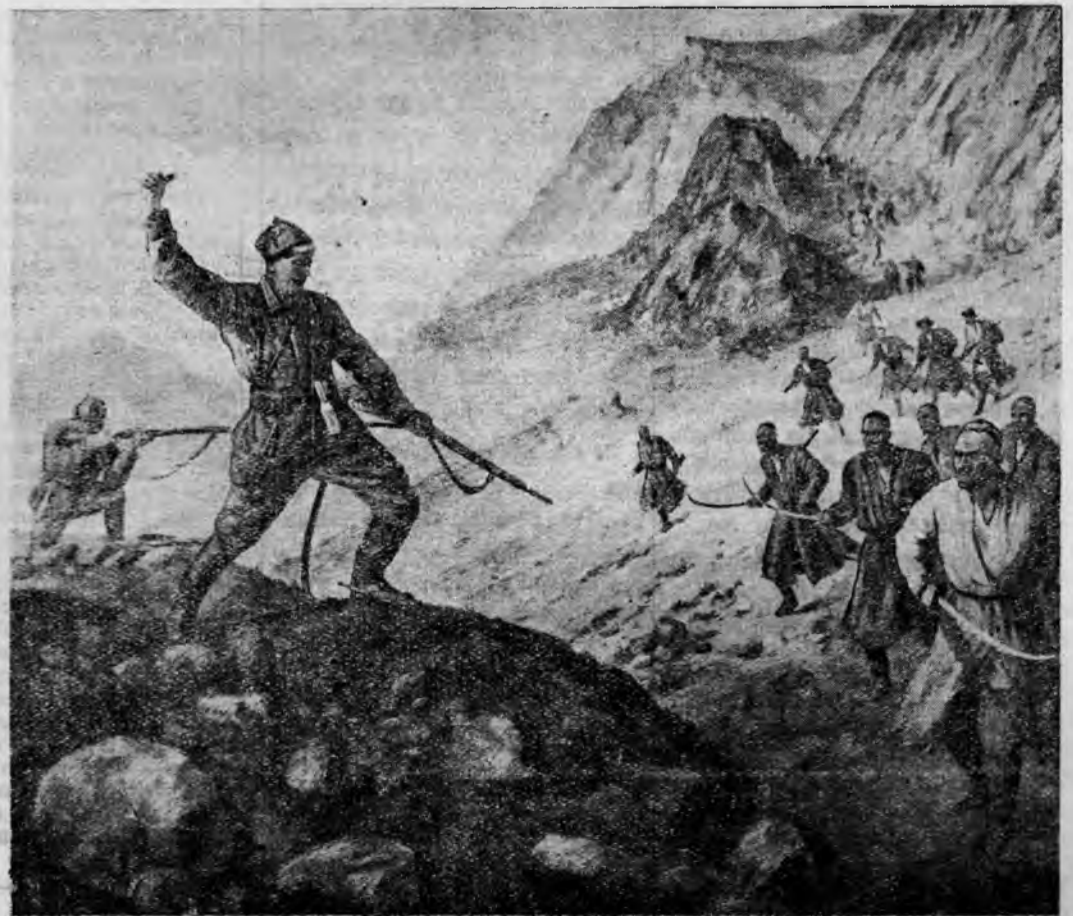
Одни из моментов борьбы со Средне-Азиатским басмачеством. Картина художника Кручинина.