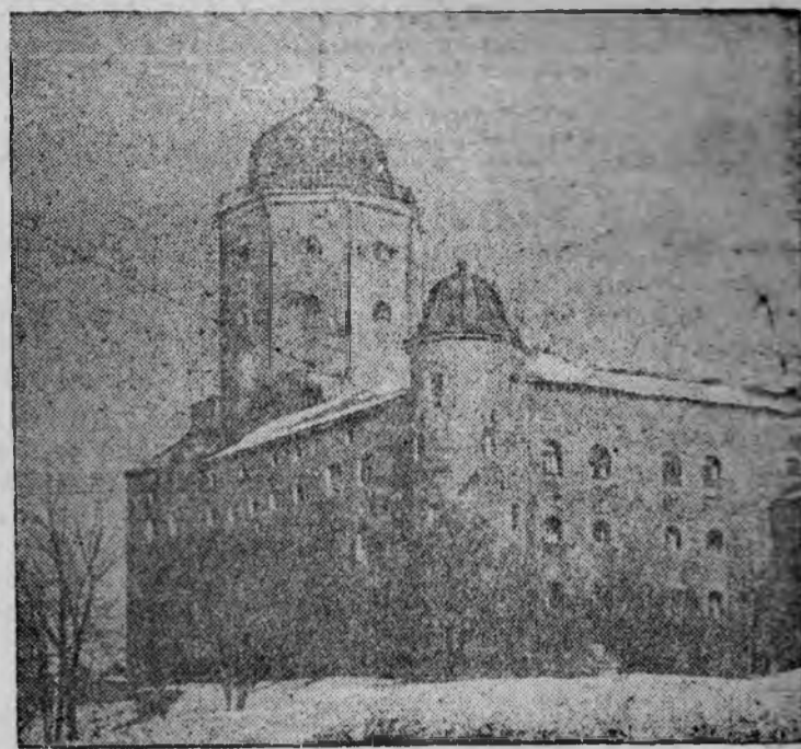
ВЫБОРГСКАЯ КРЕПОСТЬ.