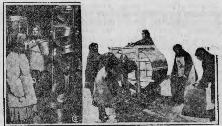
НА СНИМКЕ: Слева—очистка семезерна на машине „Змейка“ в Прилуцком отделении совхоза. Справа—сортировка семезерна в Домодедовском колхозе.

5. Обязать председателей правлений колхозов, республиканских, краевых и областных колхозсоюзов взять под свое непосредственное руководство снабжение колхозов трудовыми книжками, формами и бланками по учету труд колхозников и выдачу трудовых книжек на руки колхозникам в самый кратчайший срок.