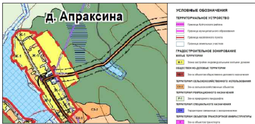
Утверждаемые изменения 1.1. и 1.2