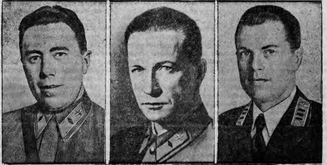
На снимке: (слева направо) депутаты Верховного Совета СССР—герои Советского Союза, товарищи: Данилин, Громов и Юмашев.

Вчера исполнилась годовщина завершения беспримерного в истории беспосадочного перелета, Москва—Северный Полюс—США, совершенного отважными советскими летчиками тт. Громым, Юмашевым, Данилиным.