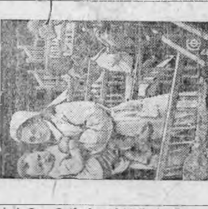
Дорожно. Детясли нандому колхозу.

Дорожно. Детясли нандому колхозу. Все они осуждены по закону от 7 августа к лишению свободы по пять лет каждого с отбыванием в концлагерях.