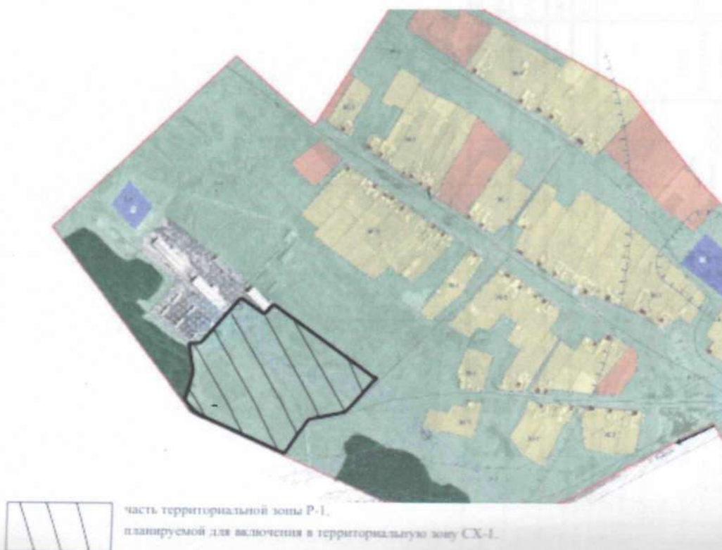
Схема места расположения планируемой территориальной зоны СХ-1 в с. Андрюшино

Приложение к постановлению администрации муниципального образования Куйтунский район от «29» октября 2020 г. № 871-п.