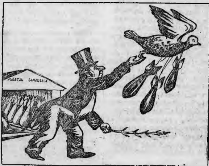
Голубь мира на новой службе. Рис. И. Миксонова.

Лига наций, по милости ее нынешних режиссеров, превратилась из кое-какого «инструмента мира», каким она могла быть, в действительный инструмент англо-французского военного блока по поддержке и разжиганию войны в Европе. (Из газет).