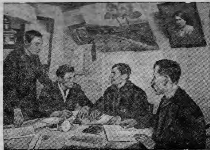
Правление колхоза обсуждает план работы.

Крестьяне деревни Комаровка Нарвской волости организовали колхоз „Красная Комаровка“. Это один из первых колхозов в Советской Эстонии. В сельскохозяйственную артель вступило 69 членов; она располагает 350 гектарами земли.