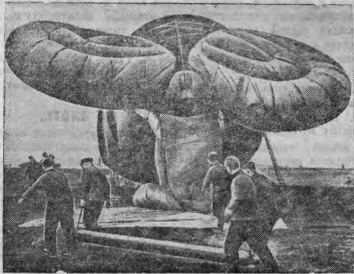
АЭРОСТАТ ВОЗДУШНОГО ЗАГРАЖДЕНИЯ В АНГЛИИ.