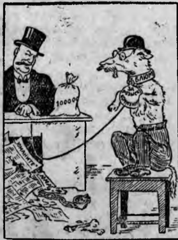
В ожидании очередного приказа. Рисунок В. Лисевича.