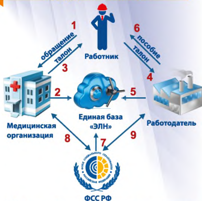
СХЕМА ВЗАИМОДЕЙСТВИЯ «Электронный листок нетрудоспособности»