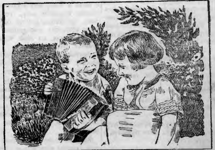
В пионергородке Дзержинского района г. Ленинграда в дер. Шалово, Лужского района, Ленинградской обл.