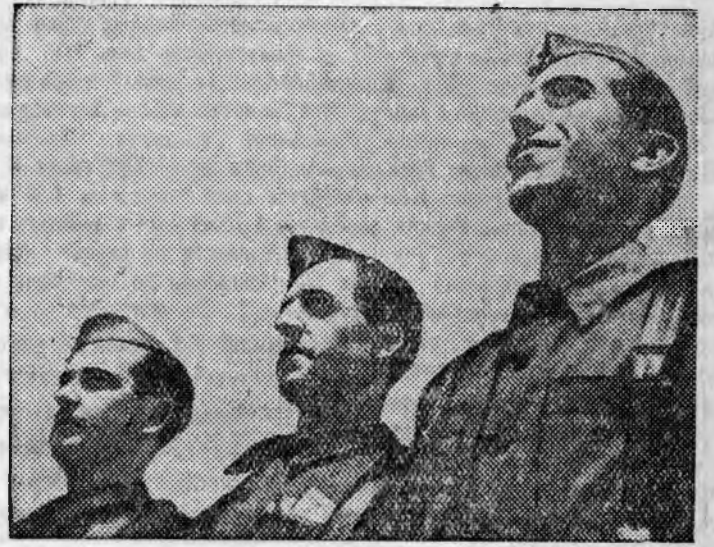
На сн: Молодые летчики республиканского воздушного флота.