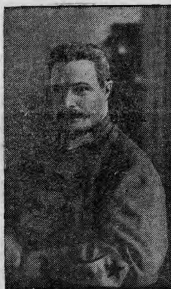
Один из организаторов и руководителей Красной Армии — М. В. Фрунзе (родился 2 февраля 1885 г., умер 31 октября 1925 г.).

На крайнем Севере авиация прочно вошла в быт трудящихся. Из Анадыря самолеты совершают регулярные рейсы в Певек, на побережье Чаунской губы, в Уэллен, бухту Амбарчик и другие отдаленные пункты. Протяженность некоторых линий превышает 1500 километров. В этом году на Чукотке перевезено на самолетах 1520 пассажиров.