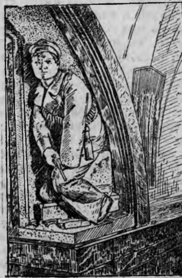
Одна из скульптур М. Маньяера — „Матрос партизан“ установленная на станции „Площадь Революции“.