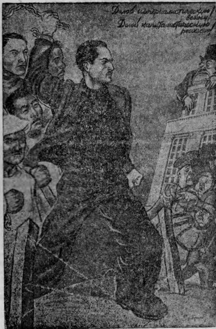
Плакат работы художника Бор Ефимова, выпущенный издательством „Искусство“. Репродукция Г. Широкова. Фото-Клише ТАСС.

Долой империалистическую войну! Долой капиталистическую реакцию!