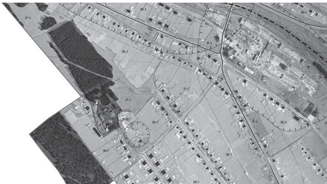
Схема расположения территориальной зоны Р-1 «Зона природного ландшафта» для включения ее в границы территориальной зоны Ж-1 «Зона застройки индивидуальными жилыми домами», в целях размещения объектов жилой застройки

Приложение 2 к решению Думы муниципального образования Куйтунский район от « » 2022 г. № .