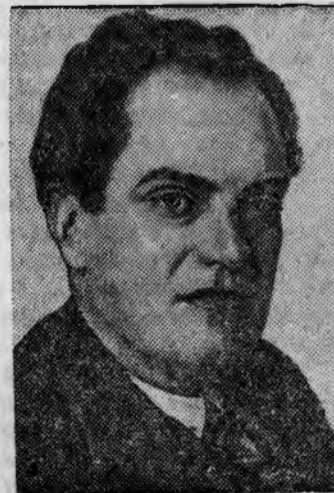
На снимке: В. В. Куйбышев.

7 июня исполнилось 50 лет со дня рождения крупнейшего деятеля партии и советского правительства, члена Политбюро ЦК ВКП(б), председателя Комиссии Советского Контроля, заместителя председателя СНК СССР — Валериана Владимировича Куйбышева, злодейски умерщвленного фашистскими бандами из „право-троцкистского блока“.