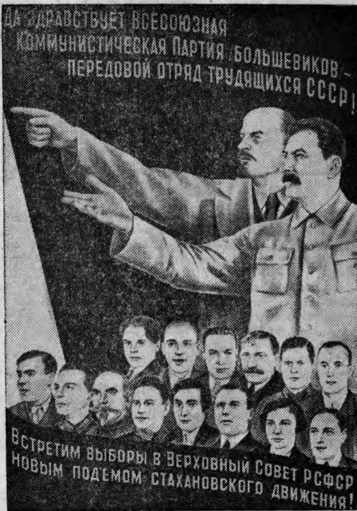
Плакаты ИЗОГИЗ'А, работы художника В. Стенберга.

Встретим выборы в Верховный Совет РСФСР новым подъемом стахановского движения!