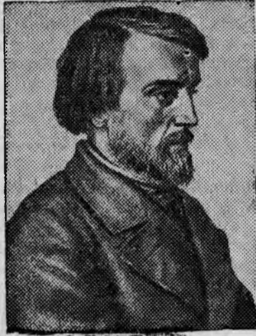
На снимке: В. Г. Белинский.

Сегодня исполняется девяносто лет со дня смерти великого русского критика—публициста Виссариона Григорьевича Белинского.