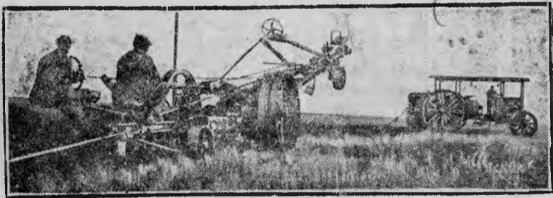
Одна из первых машинно-электрических станций в республике немцев Поволжья.

а) Хлеб с кулацкой части, оставший в мере 20 проц. взят