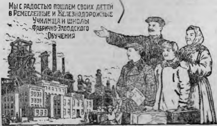
Рисунок В. Лисевича и В. Баркова.