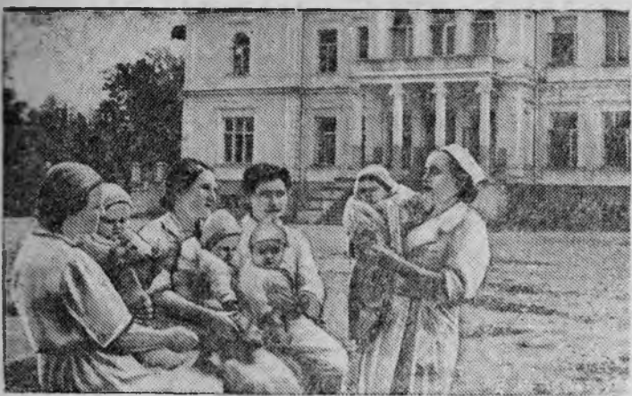
Дом ребенка в Дойлидах, в бывшем доме князя Любомирского вблизи г. Белостока, Фото Б. Вернера.