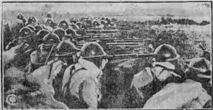
НА СНИМКЕ: Японские войска в окрестностях

Типография издательства „Коммунар“ Райлит № 2 Тираж 1500.