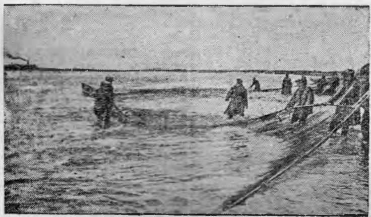
КОЛХОЗНИКИ ТЯНУТ НЕВОД.

За колхозом „Красный труженик“ (Усть-Болшеречский район, Камчатская область) закреплен бассейн реки Озерной. План улова рыбы в 1939 г. колхозники выполнили на 130 процентов.