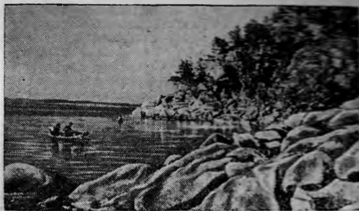
ГОЛУБОЙ ЗАЛИВ.