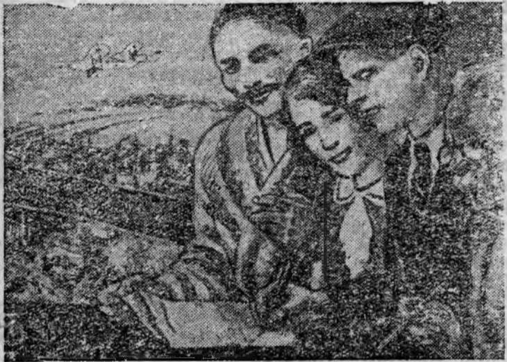
Подписной на Заем второй пятилетки (выпуск четвертого года) усилил мощь нашей цветущей, счастливой и непобедимой родины