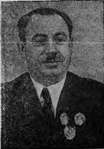
Начальник Главсевморпути Герой Советского Союза И. Д. Папанин.