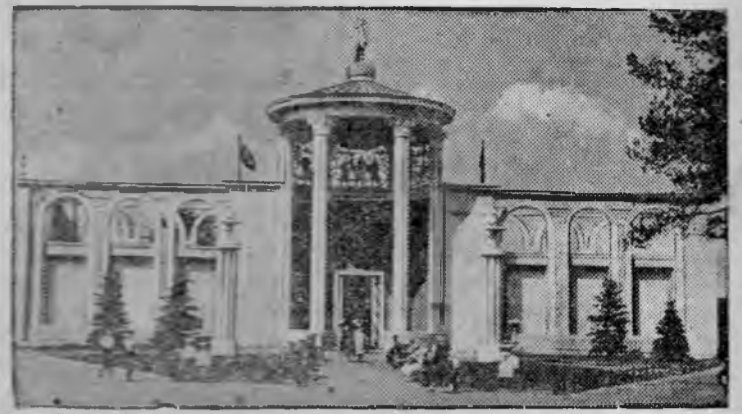
Павильон «Охота и звероводство».

Всесоюзная сельскохозяйственная выставка.