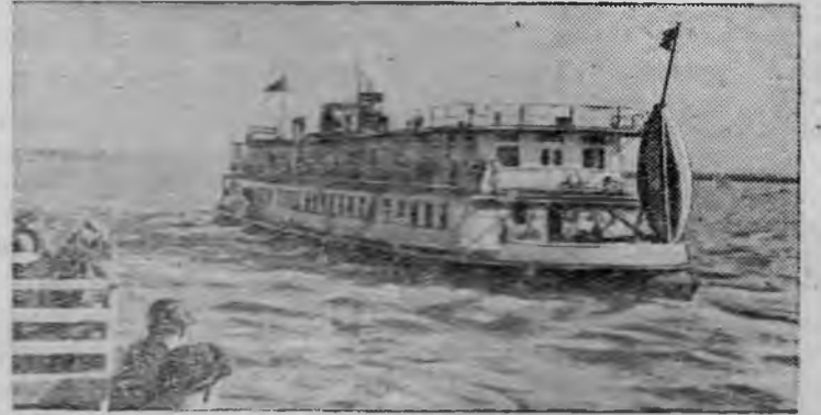
Товаро-пассажирский пароход «III Интернационал» отходит от Омского речного вокзала в рейс на север—Омск—Енисейск.