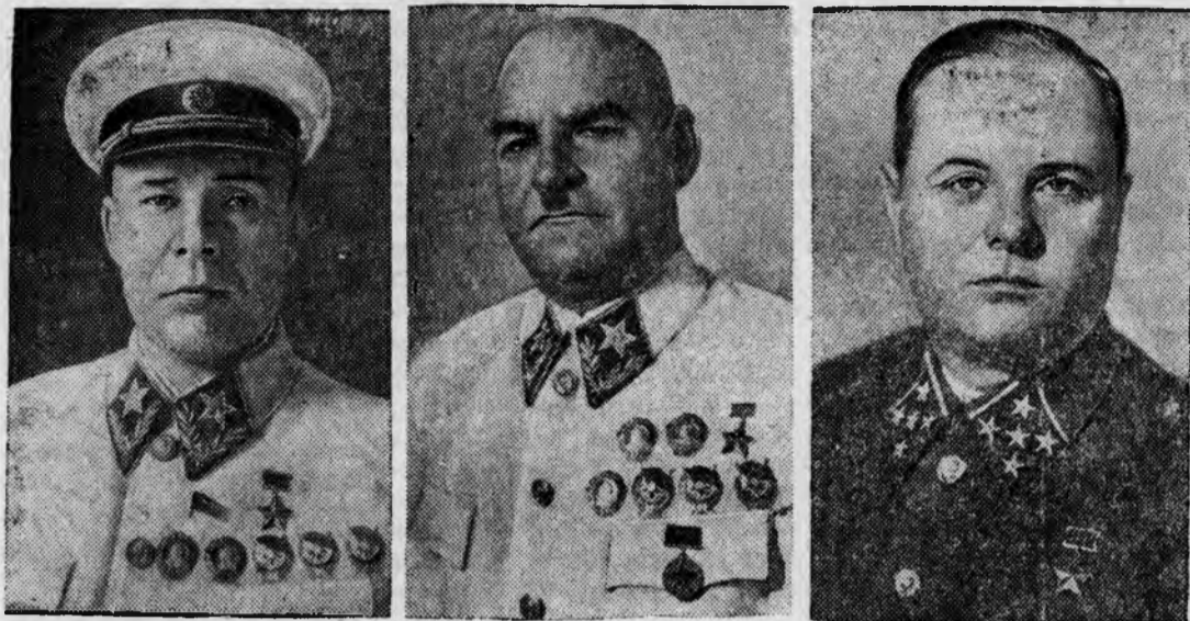
На снимках: (слева направо): Народный Комиссар Обороны СССР Маршал Советского Союза Семён Константинович ТИМОШЕНКО, Маршал Советского Союза Григорий Иванович КУЗНЕЦОВ, начальник Генерального Штаба РККА Генерал армии Кирилл Афанасьевич МЕРЕЦКОВ.