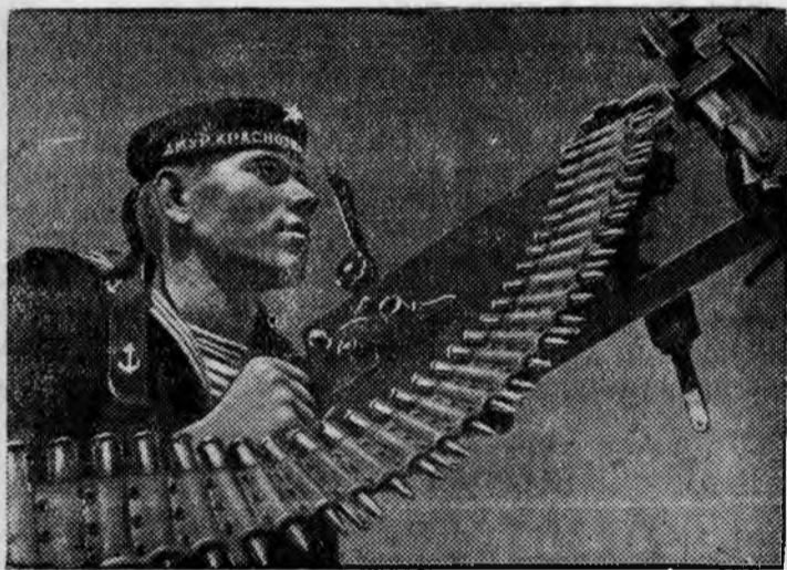
Пулеметчик Краснознаменной Амурской флотилии.