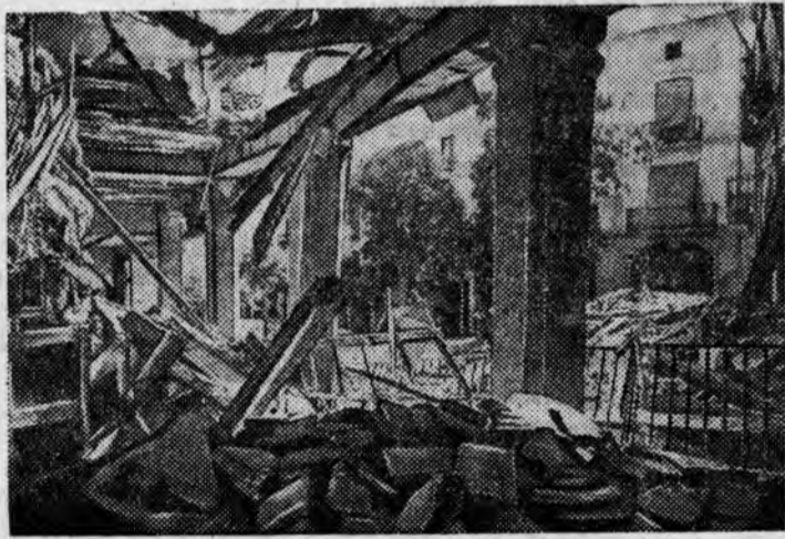
На сн.: Дома, разрушенные бомбардировкой итало-германских самолетов, в одном из городов Каталонии.