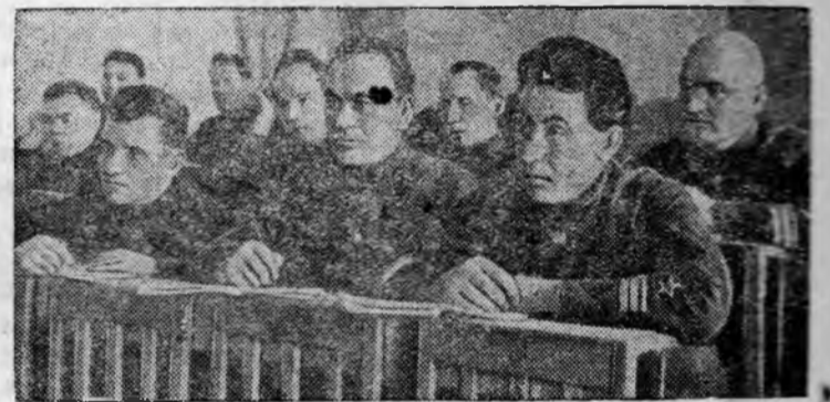
В лектории выходного дня при Доме партийного образования Амурской Краснознаменной Флотилии.

Помощник бригадира тракторной бригады № 8, Чеботаревской МТС.