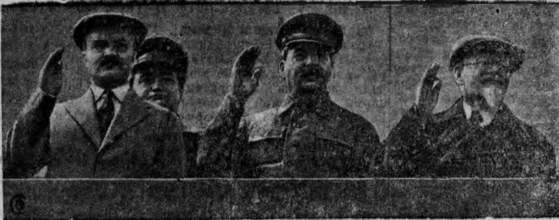
Первомайский парад на Красной площади. НА СНИМКЕ: т. т. Сталин, Молотов, Калинин и Димитров на трибуне.