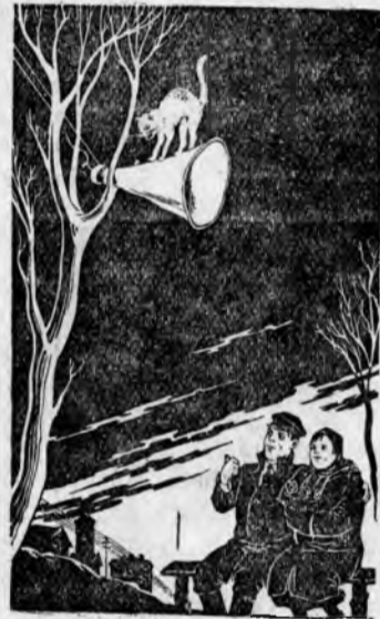
— Никак, наш радиосузел снова заработал...

Рисунок К. Теодоровича. Бюро-клише ТАСС.