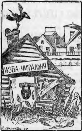
«ХАТА С ПРАЮ».