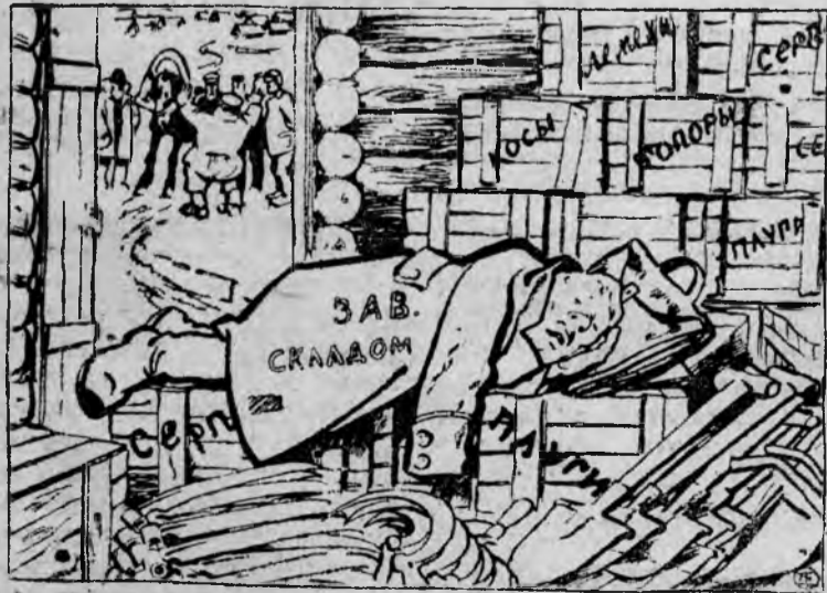
„Над продвижением машин надо поработать“.