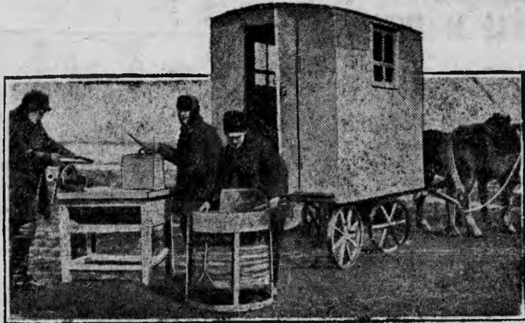
18 марта совхоз „Горная Поляна“ (Сталинградский район) провел проб-ный выезд в поле. Выезд показал полную готовность к началу больше-вистского сева.

НА СНИМКЕ: Походная ремонтная мастерская.