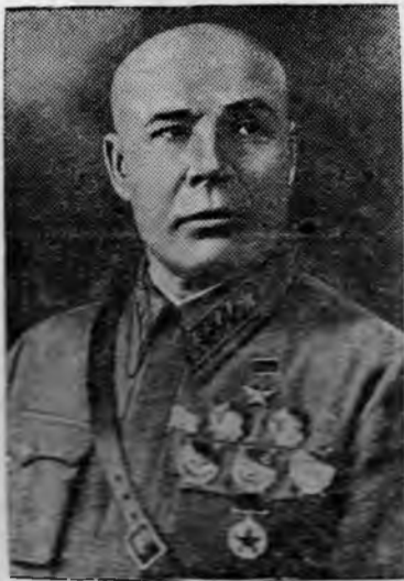
Народный Комиссар Обороны СССР, Маршал Советского Союза, Герой Советского Союза С. К. Тимошенко.

С. К. Тимошенко назначен Народным Комиссаром Обороны СССР.