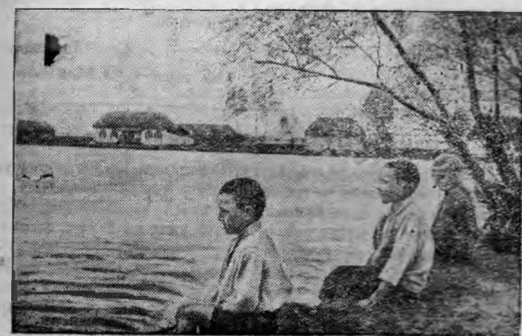
Один из прудов колхоза «Железнодорожник».

Таловский район Воронежской области расположен в засушливой зоне, где не имеется ни одной проточной реки. Колхозники сельскохозяйственной артели «Железнодорожник» обязались построить новый большой пруд, водослив и 10 колодцев, отремонтировать существующие пруды, водосливы и колодцы, организовать поливку овощей и т. д. Одновременно они обратились ко всем колхозам Воронежской области с призывом последовать их примеру.