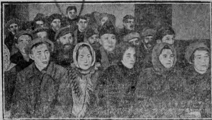
НА ВЫБОРНОМ СОБРАНИИ