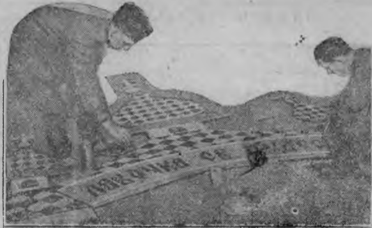
Готовят уголок безбожника