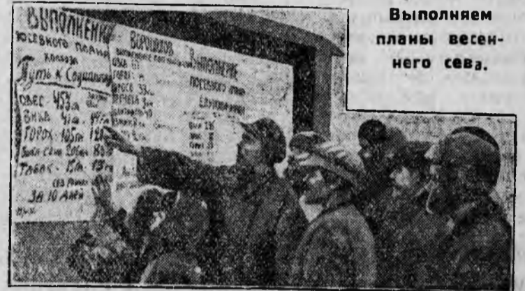
Выполняем планы весеннего сева.

Всю массовую работу с колхозниками и единоличниками, борьбу за укрепление колхозов и выполнение плана сева, подчинить основной задаче— коллективизации всей бедноты, батрачества и середняков и выполнению программы 3-го решающего года пятилетки.