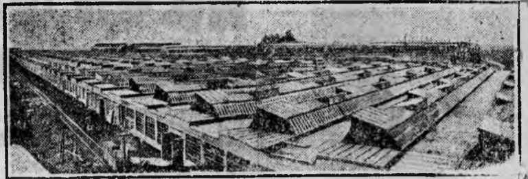
Гигант из 518 Харьковский тракторный завод будет пущен 1-го июля 1931 года, стоимость завода 112 миллионов рублей.

Рабочие-ударники заводов РСФСР горячо приветствуют призыв Московского электростанции о выпуске займа третьего решающего года пятилетки. Двенадцатитысячный коллектив Сталинградского тракторного завода в резолюциях, принятых на цеховых собраниях заявляет: „Для завершения фундамента социализма в третьем решающем году, также скорейшего пуска 518 предприятий и 1040 машино-тракторных станций, требующих огромные затраты, мы предлагаем правительству СССР в ближайшее время выпустить новый заем. Обязуемся обеспечить успех по распространению“.